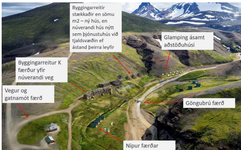
Mynd 2 Líkanmynd af fyrirhuguðum breytingum í upp færðu deiliskipulagi og helstu breytingar merktar inn (Úr greinargerð Fannborgar)

Samkvæmt greinargerð framkvæmdaraðila verður lögð áhersla á að allar framkvæmdir falli vel að landslagi og ásýnd svæðisins og tekur efnisval og litir bygginga mið af því.